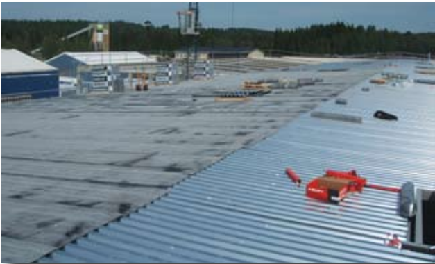
Direkt på plåten ligger en diffspärr på 2,5 mm.