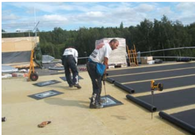
På isoleringen läggs Derbigum SP 4 mm. Ett tak med maximal trygghet och ekonomi.