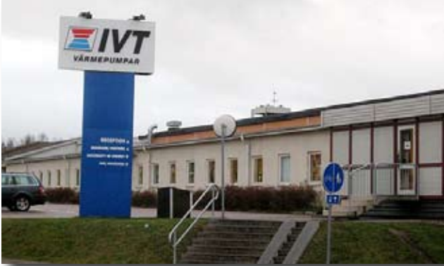
IVT förvandlar naturens egen värme till behagligt inomhusklimat.